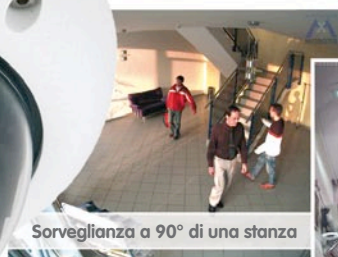
Sorveglianza a 90° di una stanza